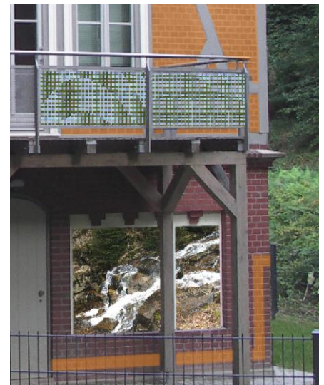
Ansicht mit Farben und Texturen

Texturen aus der Texturbibliothek werden im Bild in der Perspektive in der richtigen Größe dargestellt. Zusätzlich lassen sich beliebige Bilder als Poster einfügen.