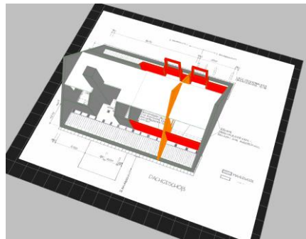
3D-Bauteile auf gescanntem Plan

On-Site Photo bietet die Drag & Drop Gestaltung mit Brillux Farben und einer umfangreichen Textur-Bibliothek.